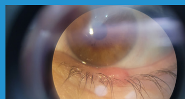
Chalación en el párpado inferior del ojo izquierdo.